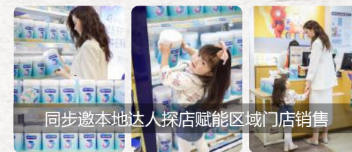
同步邀本地达人探店赋能区域门店销售