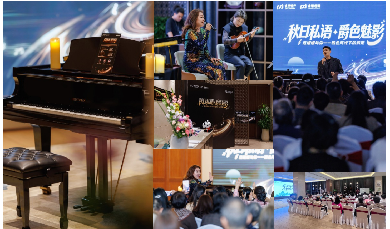
国学讲座 × 秋日爵士音乐会