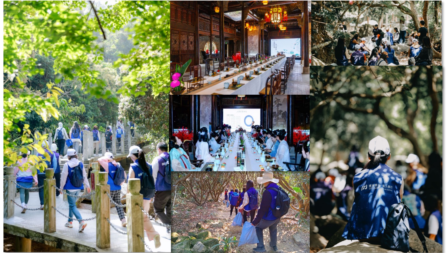
公益净山徒步 × “森生不息” 公益疗愈 × 沉浸式古文化私享会