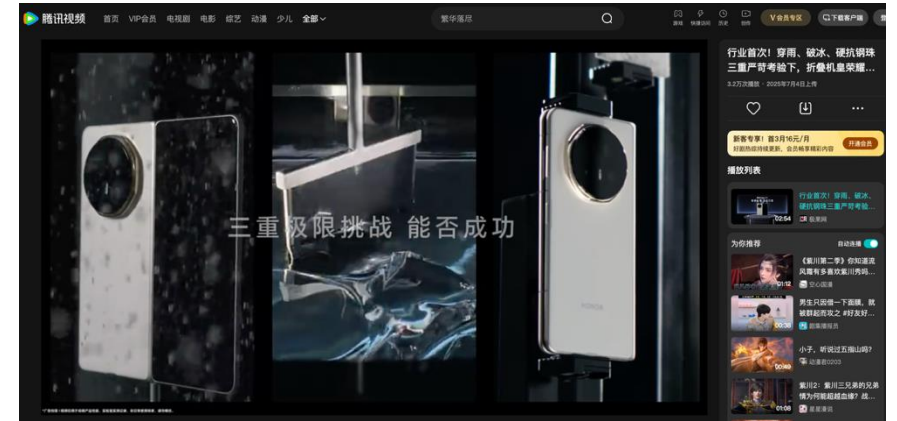
部分上线内容截图