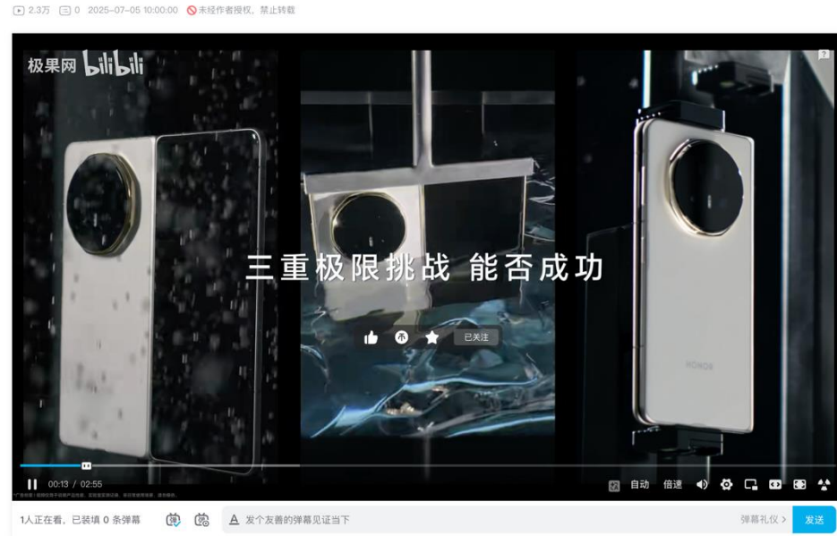
行业首次！穿雨、破冰、硬抗钢珠三重严苛考验下，折叠机皇荣耀Magic V5能否完美通关？

全平台传播形成强势声量共振，播放+阅读量共计可达100万，成功打破折叠屏产品的传播圈层局限，通过极致测试与技术解码，荣耀 Magic V5“全球最薄 + 满血坚固”的双重标签深入人心，成功扭转用户对“超薄折叠屏脆弱”的固有认知，建立起“轻薄与坚固兼得”的清晰心智，显著降低潜在用户的购买顾虑，同时，极限测试的营销形式充分彰显了荣耀在折叠屏技术领域的创新实力，进一步深化了“高端、可靠、技术驱动”的品牌形象，巩固了其在高端折叠屏赛道的引领地位。