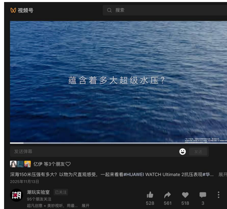
部分内容上线截图

本次营销深度整合视频号、公众号、抖音、小红书、搜狐视频、腾讯视频、爱奇艺、百度百家、今日头条等全类型主流平台，围绕测试原理与场景价值核心方向打造内容，以深度化内容输出、实用性价值传递为核心，完成全渠道、分圈层的精细化传播布局，精准触达户外探险、潜水垂直人群与泛大众用户双群体。