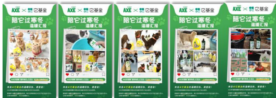
10个救助人返图，真实场景种草