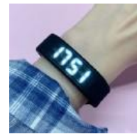
佩戴科技手环，加强科技感