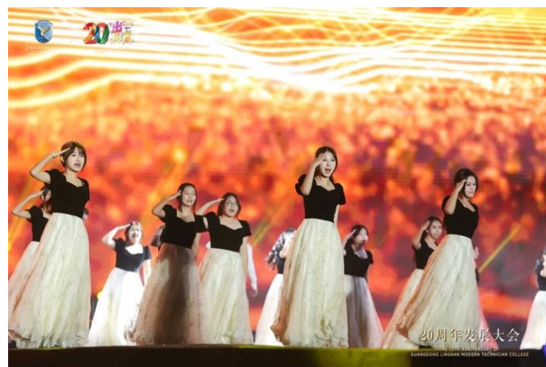
合唱《TRY EVERY THING》