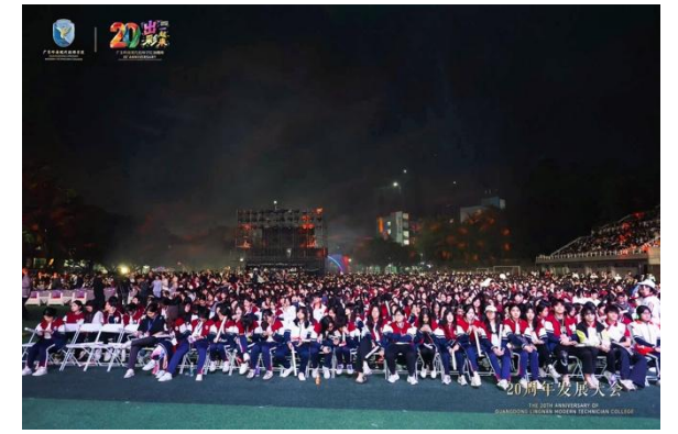
现场检票出入口配备相对应人数志愿者配合效疏通人流，避免人流拥挤