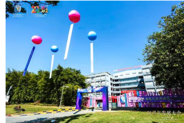
广东岭南现代技师学院二十周年发展大会-校园环创