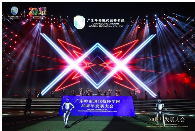
人机共舞《舞动科技》