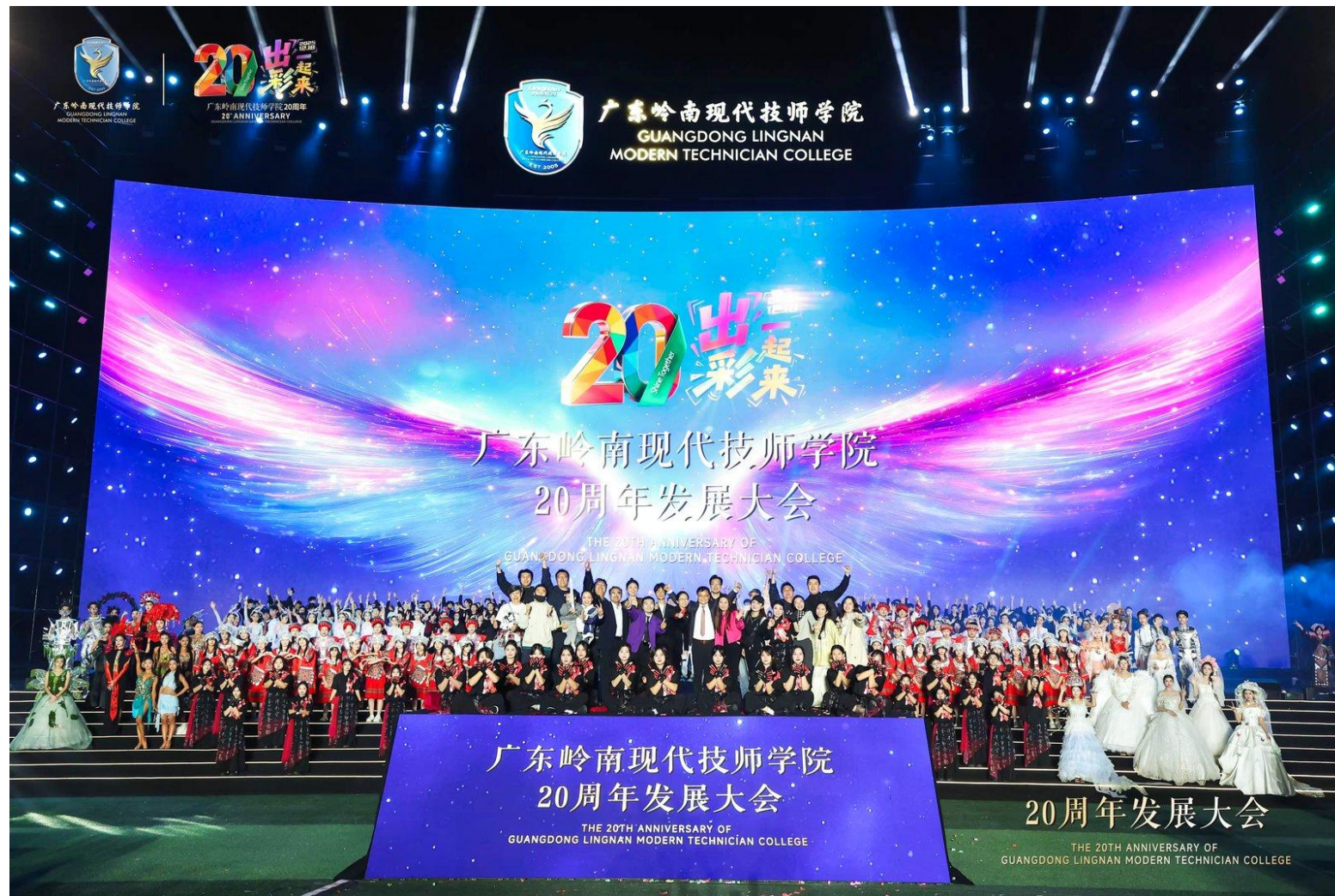
演职人员合影留念