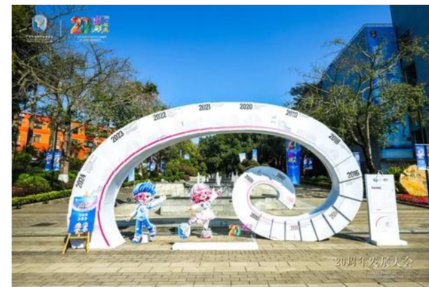
广东岭南现代技师学院二十周年发展大会-校园环创