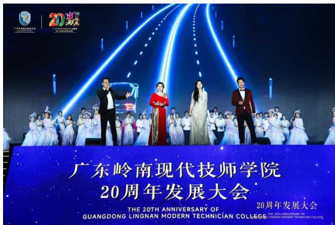
歌伴舞《二十年后再相会》