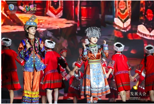
民族歌舞《杜鹃红透三都》