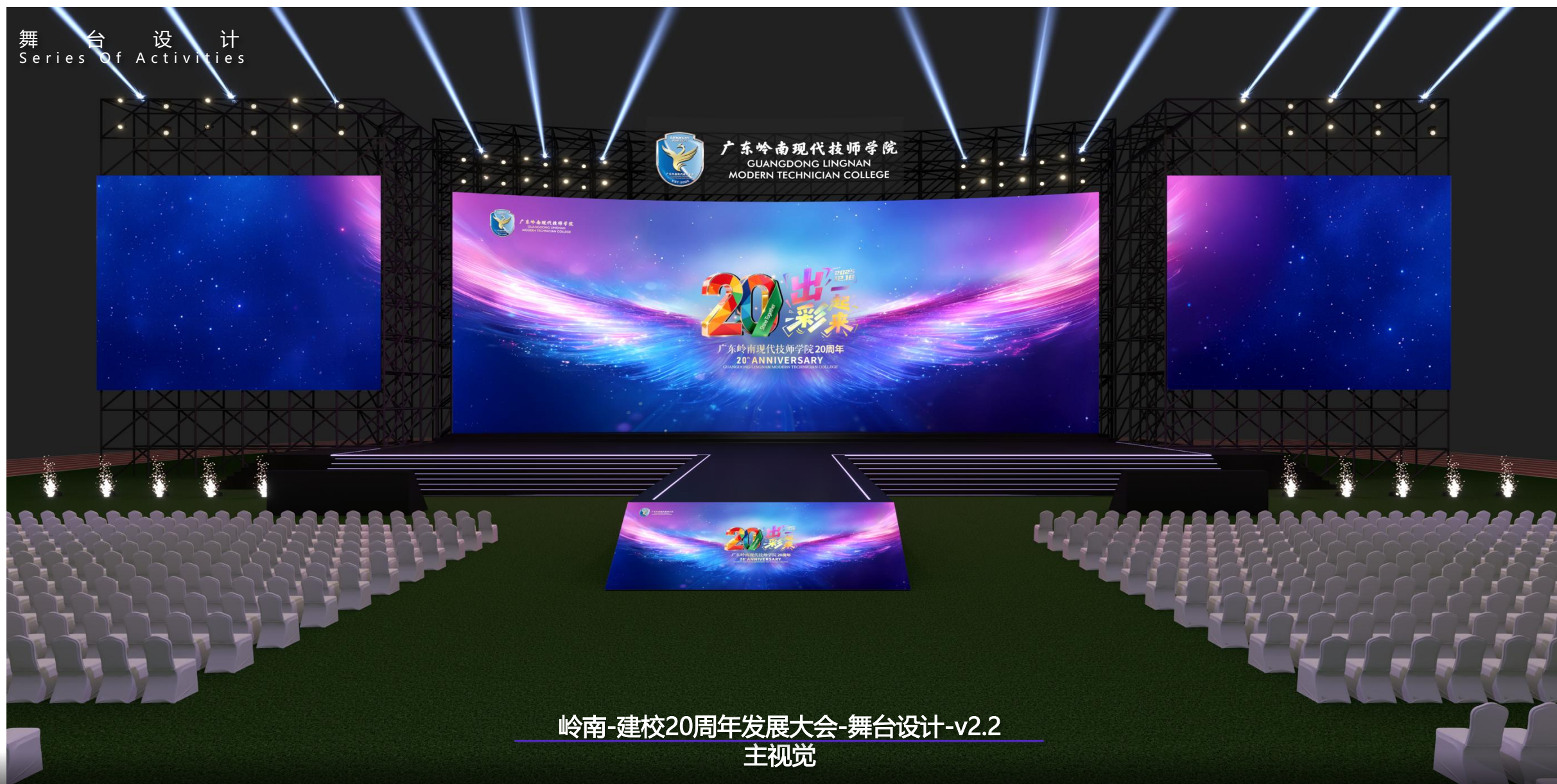
岭南-建校20周年发展大会-舞台设计-v2.2 主视觉