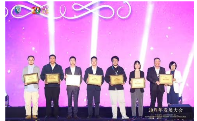
优秀合作企业表彰