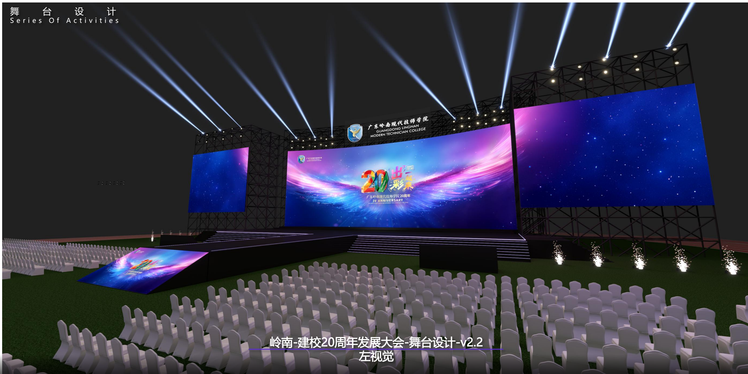
岭南-建校20周年发展大会-舞台设计-v2.2 左视觉