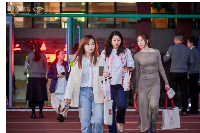
现场规划6个检票出入口并配备相对应人数志愿者配合验票，有效疏通人流，避免人流拥挤