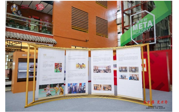
华外同文十周年校历史展览