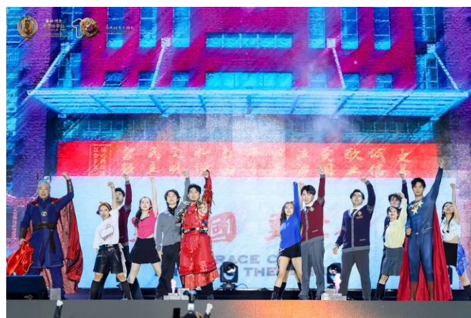
舞台剧第三幕-《荣耀绽放》升华主题：相信自己，永不放弃，不断超越自我，