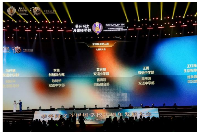
荣耀星愿-ROUND2-大疆无人机