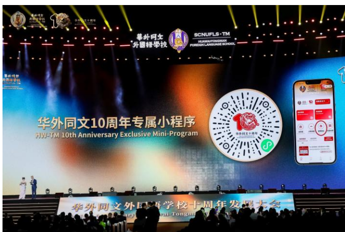
荣耀星愿-ROUND2-80份和睦家体检