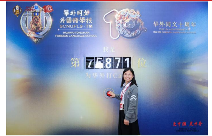
华外同文十周年校历史展览