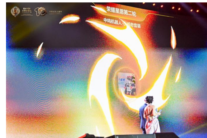
荣耀星愿-ROUND2-中鸣机器人