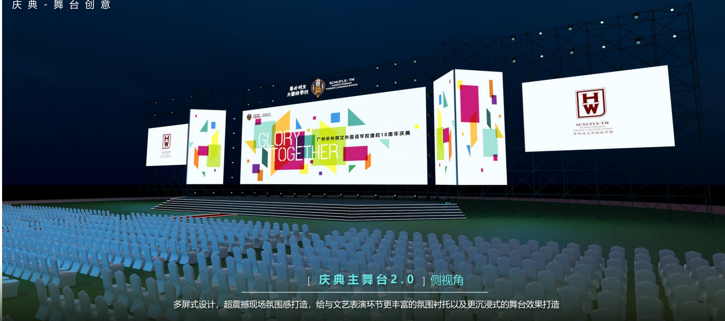
[ 庆典主舞台2.0 ] 侧视角

多屏式设计，超震撼现场氛围感打造，给与文艺表演环节更丰富的氛围衬托以及更沉浸式的舞台效果打造