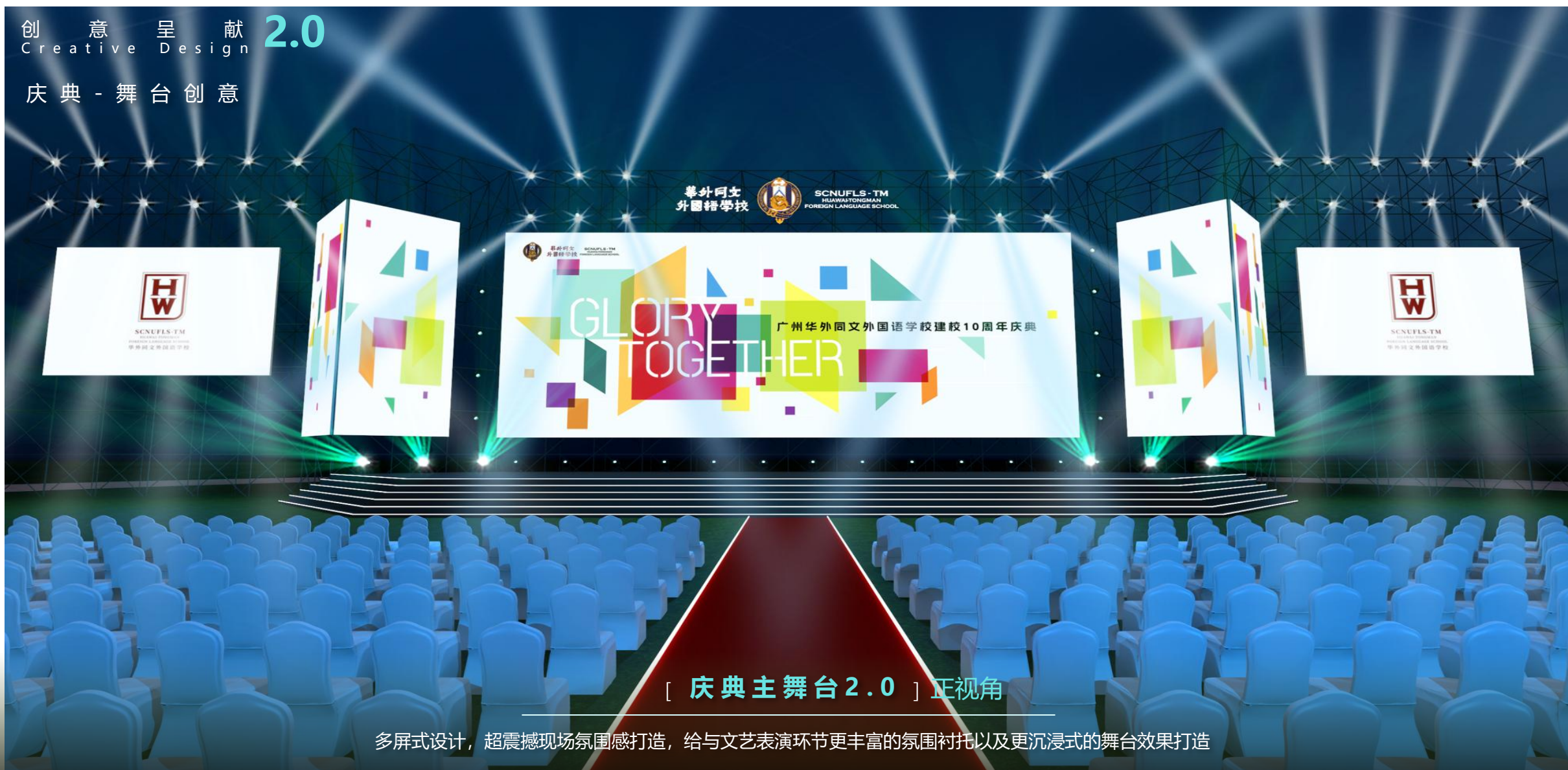
[ 庆典主舞台 2.0 ] 正视角

多屏式设计，超震撼现场氛围感打造，给与文艺表演环节更丰富的氛围衬托以及更沉浸式的舞台效果打造