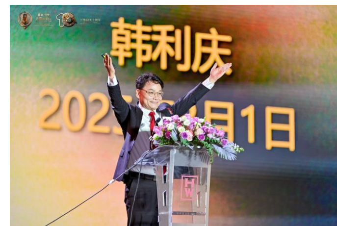
《荣耀展望》-韩博士提出对华外的期许和美好的祝愿