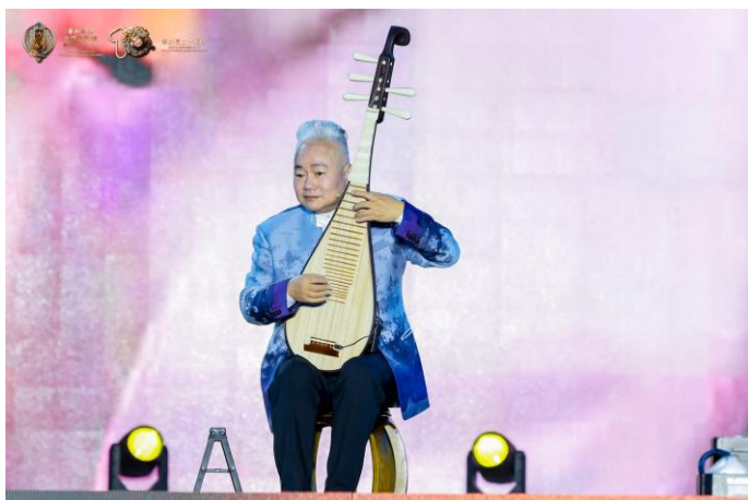
民乐表演-方锦龙-《玄鸟》