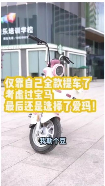
仅靠自己全款提车了 考虑过宝马 最后还是选择了爱玛!