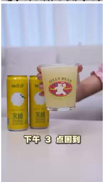
下午 3 点困到