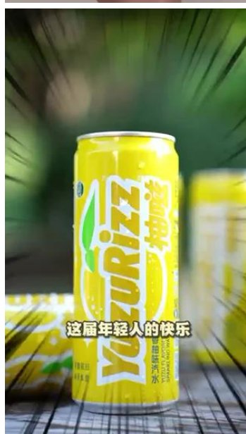
这届年轻人的快乐