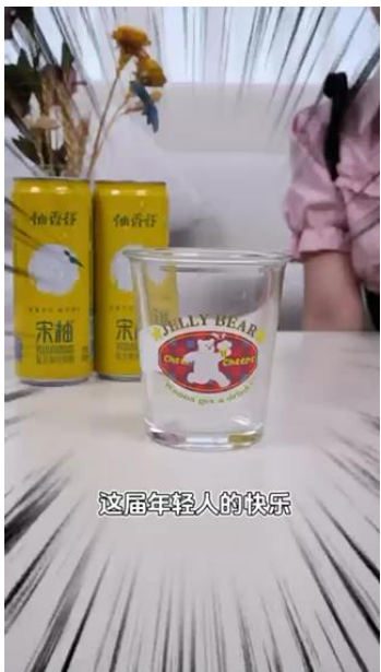
这届年轻人的快乐