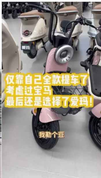
仅靠自己全款提车了 考虑过宝马 最后还是选择了爱玛!