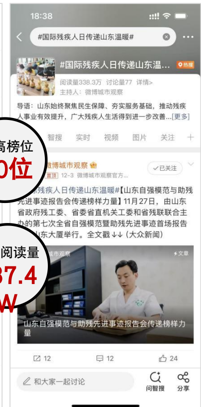
同城热搜#国际残疾人日传递山东温暖#