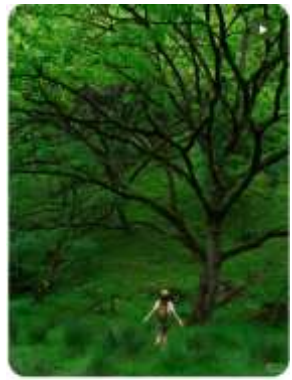
“你要不要问我去听听“野”的风” 智慧seven 326