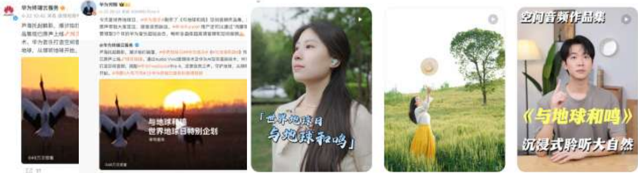
世界地球日 | 守护地球，从倾听地球开始