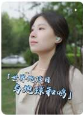
4.22世界地球日，让我们「与地球和鸣」 耳机五典 10