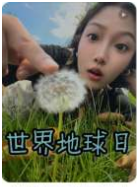
今天借世界地球日一起为地球做点小事吧！ 一只炸鸡牛 374