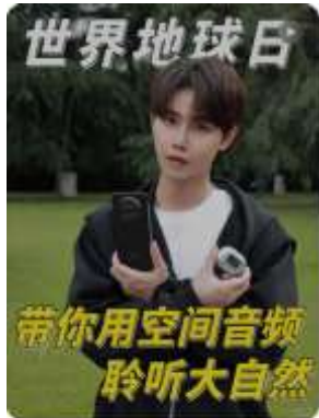
耳机党狂喜！用空间音频感受自然的音符 何碧源日记 900