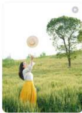
镜头不止记录美景，更想守护它们 西西美美 267