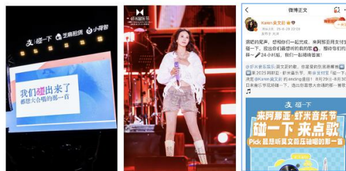
定制点歌VJ 艺人口播 微博预热