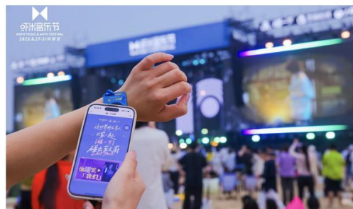
“碰一下点歌”乐迷手环，超3万乐迷点出压轴歌曲