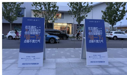
定制支付宝x音乐节标语广告，阿那亚社区投放