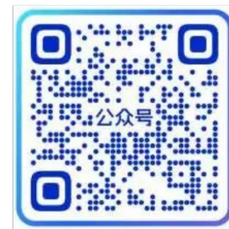
优酷娱乐营销公众号