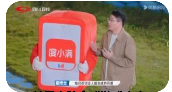
基于人脸合成游戏内容 度小满霍博士原生融入，渗透品牌技术