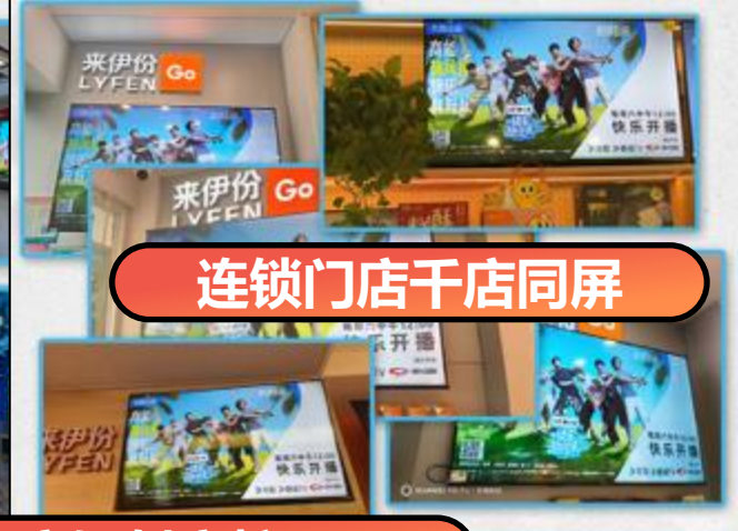
连锁门店千店同屏