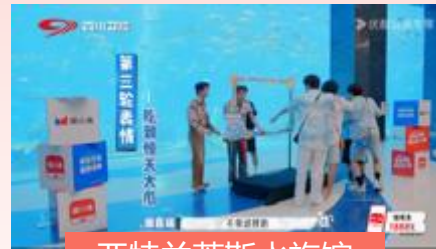
亚特兰蒂斯水族馆