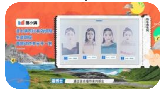
深度讲解度小满防深度伪造系统 可以有效识别生成瑕疵等微小问题