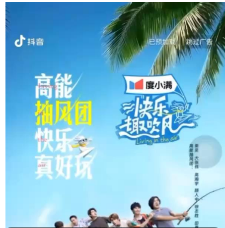
抖音开屏稀缺资源助力