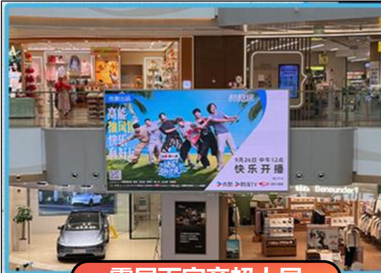
霸屏百家商超大屏