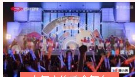
十年之约歌会舞台