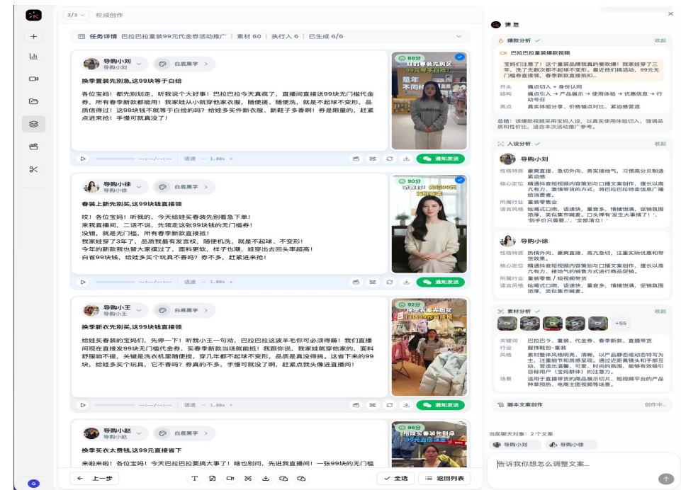
一键分发多位KOS (图片仅为示例)