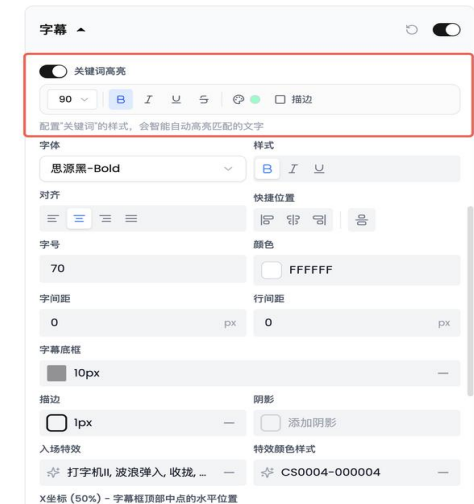
自定义包装样式，AI自动包装 (图片仅为示例)