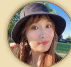
@狗蛋妈妈在加拿大

加拿大“纪检委”实地探厂+商超走访，爆梗锐评加拿大被薅秃的本地奶粉，背后竟是国货！