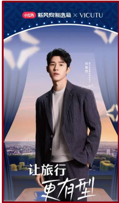
线上H5曝光活动 引流线下活动打卡