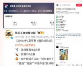
赛事全渠道官宣高热度