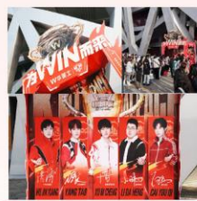
年度总决赛展台品牌区