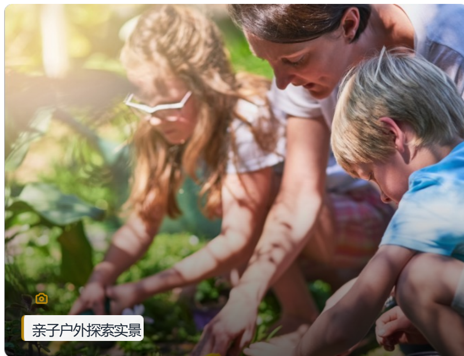
亲子户外探索实景