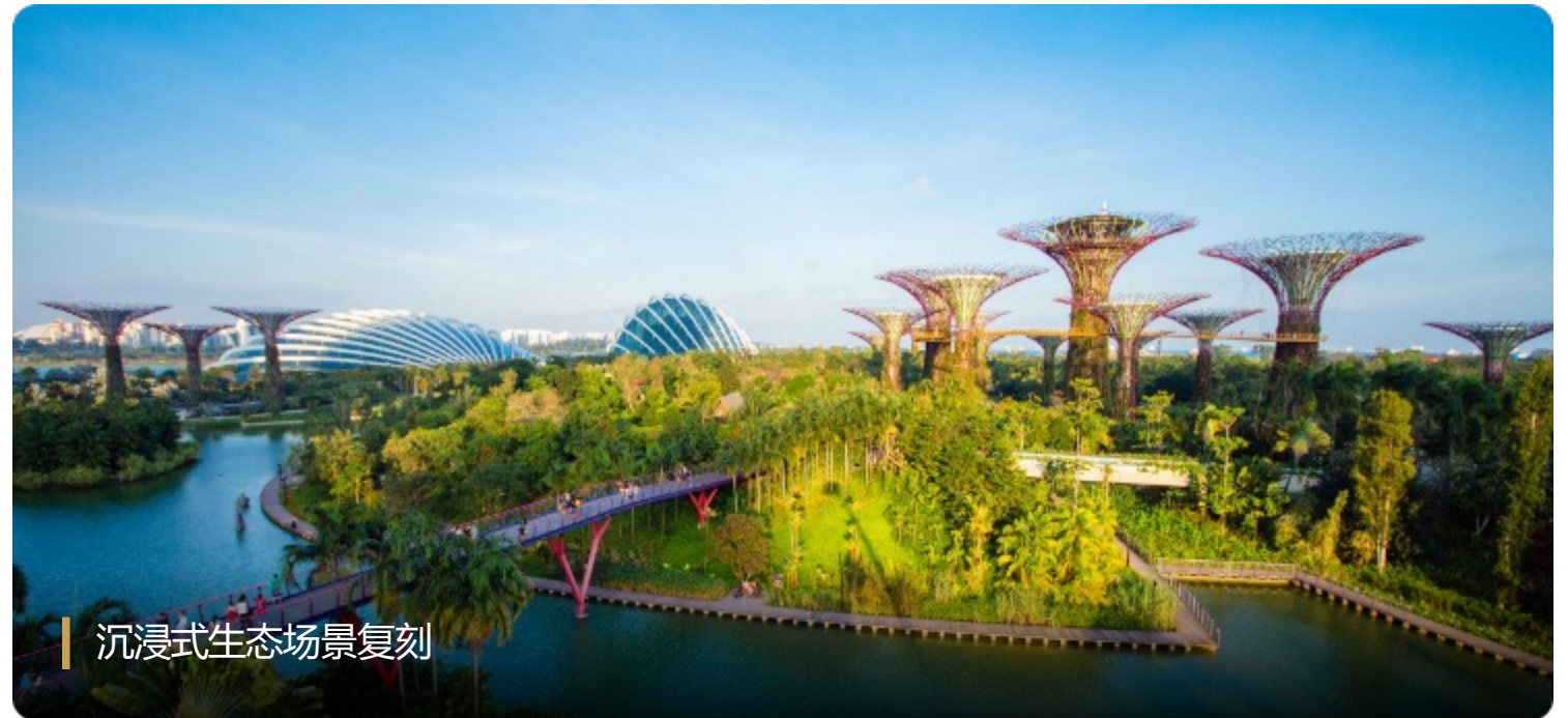
沉浸式生态场景复刻