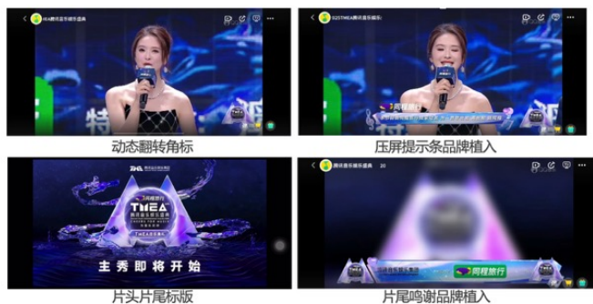
视频流包装 (视频可点击播放)