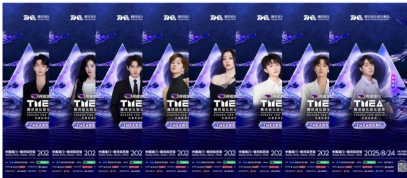
艺人海报 (部分艺人)