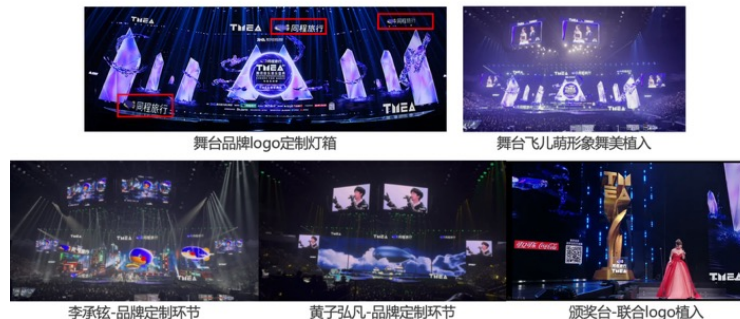
线下权益-典礼主舞台