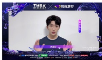
黄子弘凡ID (视频, 可点击播放)