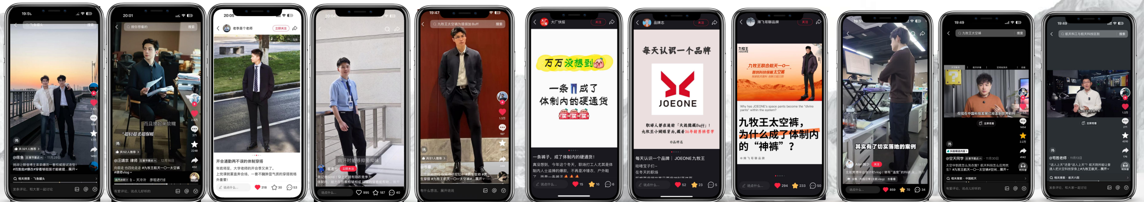
航天垂类达人强背书