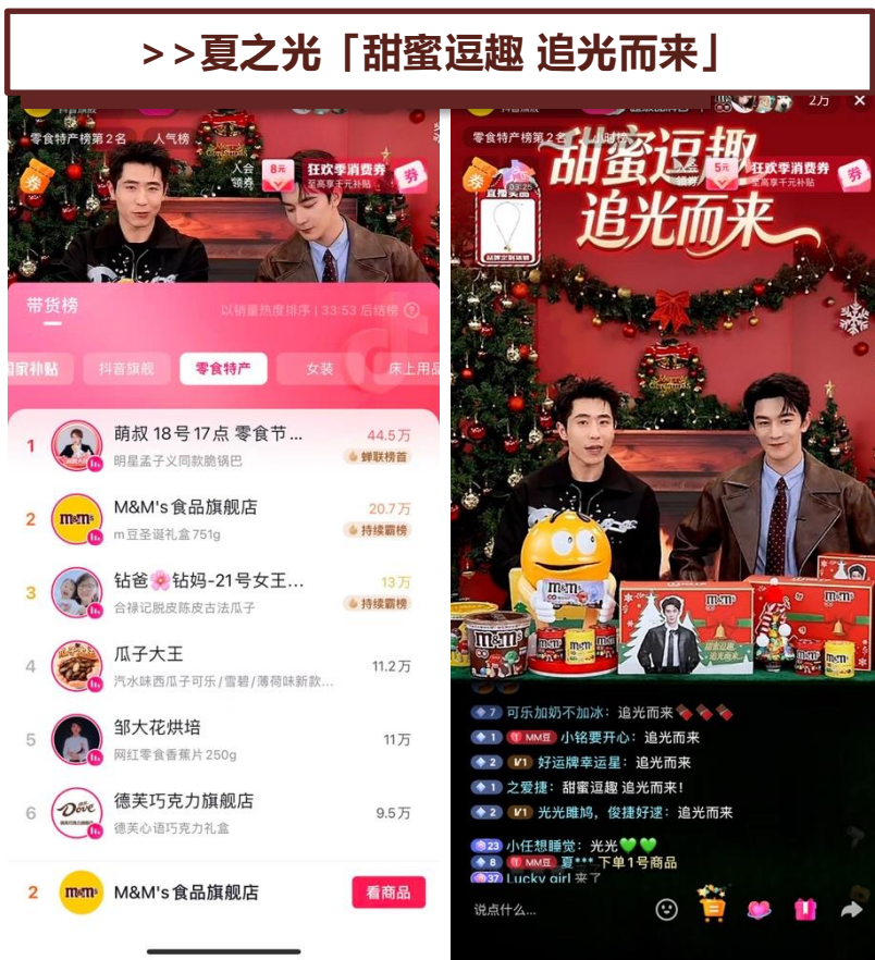
>> 夏之光「甜蜜逗趣 追光而来」