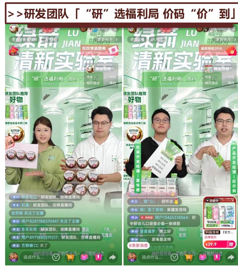
>> 研发团队「“研”选福利局 价码“价”到」