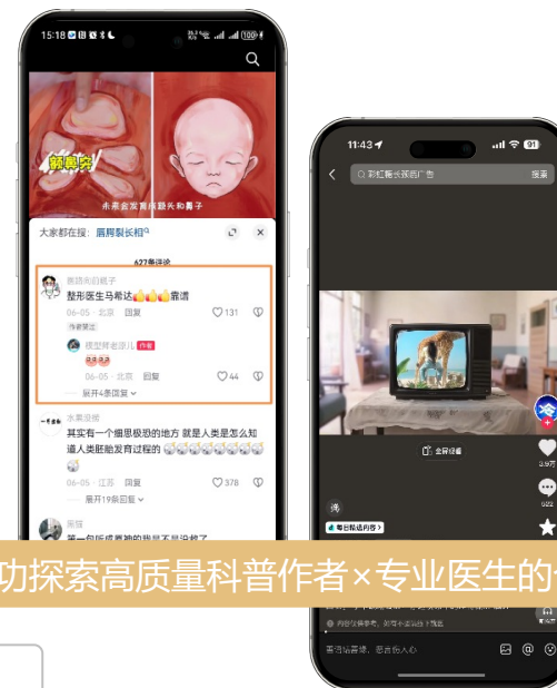
成功探索高质量科普作者×专业医生的合作模式