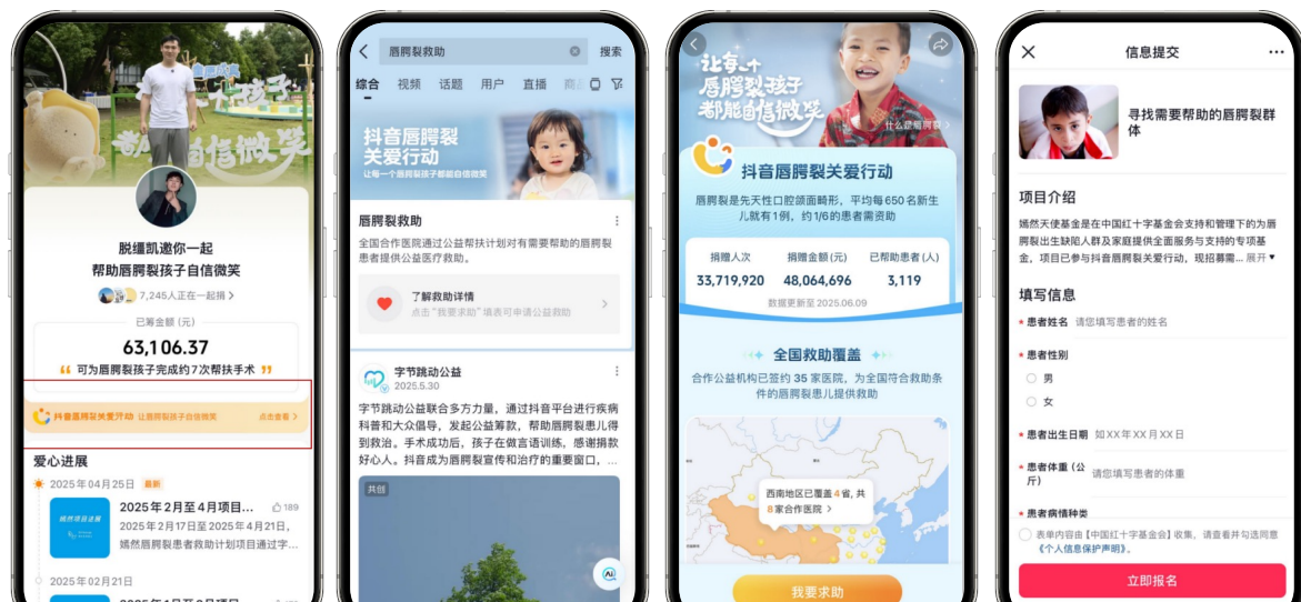
抖音搜索“唇腭裂救助、唇腭裂公益”等关键词直达救助入口

抖音平台通过智能推荐将许多不了解有相关救助活动的唇腭裂患儿家庭与公益机构形成高效连接。 为进一步提高救助效率，字节跳动公益上线“唇腭裂救助”搜索直达页面，抖音搜索“唇腭裂救助”直接显示救助入口。