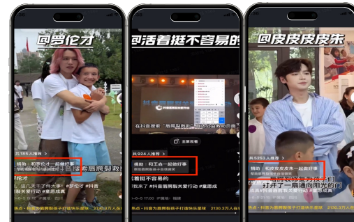
达人公益内容抖音累计播放量1.57亿，获赞620万

超人气IP皮卡丘和奶龙携周边礼物参与夏令营活动，现场与小朋友惊喜互动。抖音创作者们也化身小课老师和助教，陪孩子们学习口型和呼吸节奏，进行发音练习，并一起做小游戏。