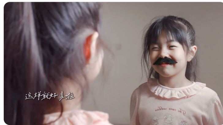
学生作品《沉默的一分钟》