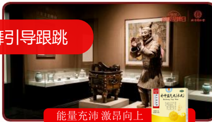
能量充沛 激昂向上