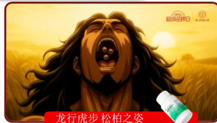
龙行虎步 松柏之姿