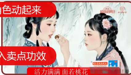
活力满满 面若桃花