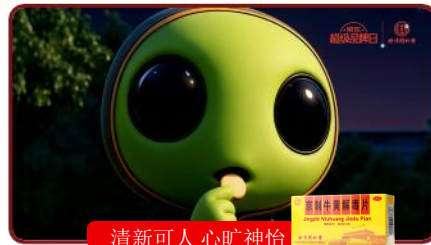
清新可人 心旷神怡