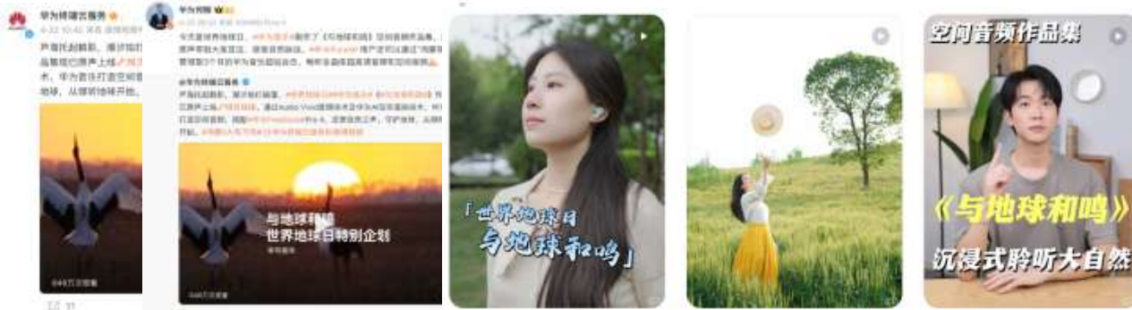
世界地球日 | 守护地球，从倾听地球开始