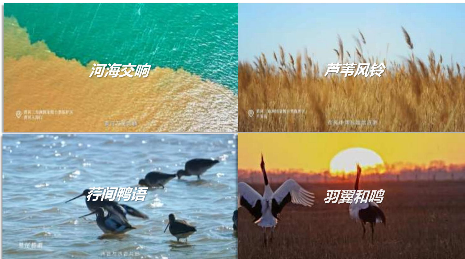
拍摄地：黄河三角洲国家级自然保护区