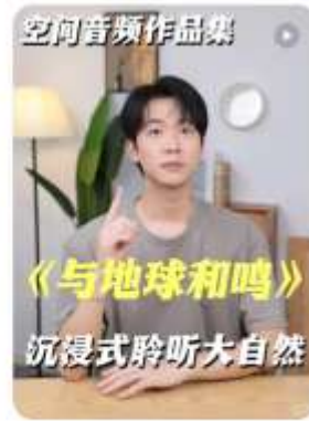
《与世界和鸣》的空间音频，太让我破防了！ Steven谢长廷 567